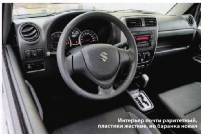
Интерьер почти раритетный, пластики жесткие, но баранка новая

есть выбор между «механикой» и «автоматом». Самый заметный рестайлинг был проведен в 2013 году, когда изменились передний бампер, решетка радиатора, на капоте появился агрессивный воздухозаборник, а мотору добавили аж 3 л.с. Впрочем, на этом не закончилось: уже через год сделали новый щиток приборов и чуть-чуть изменили форму баранки. Скорее всего обновлять JB32 больше не будут: в Женеве покажут прототип Jimny нового поколения. ■■■